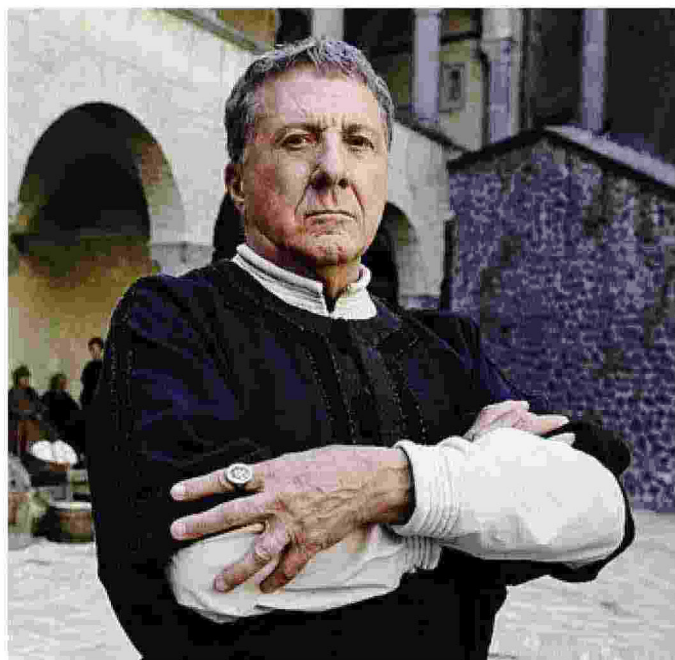
Dustin Hoffman sul set de «I Medici»