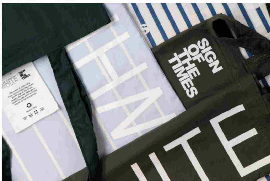
Le shopper di White, realizzate da Albini Group con tessuti dal colore sostenibile

Riso Gallo, una delle più antiche risiere italiane, ha fornito la materia per ALBINI_next, un innovativo e ambizioso progetto di upcycling. Off the Grain – questo il nome del progetto – usa l'acqua di bollitura della lavorazione del riso nero, non più utilizzabile per uso alimentare, per trasformarla in una tintura naturale. La colorazione che si ottiene da questo processo, inoltre, garantisce anche un risparmio di acqua tra il 30 e il 40%.