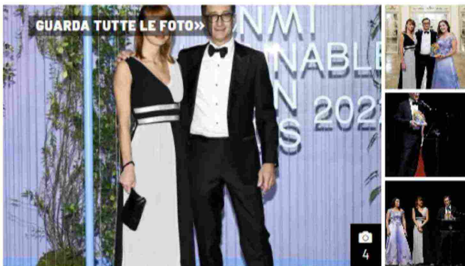
Ad Albini Group il premio The Groundbraker Award Il premio The Groundbraker Award è rivolt