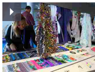
MareDiModa rivede la Florida

Ad oggi, utilizzando 950 kg di scarti di tessuto, sono state prodotte circa tre tonnellate di carta , che Albini Group utilizza per i supporti di presentazione della collezione Denim e del Service Program del brand Albiate 1830.