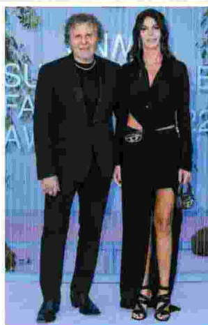
Dall'alto, in senso orario, Giorgio Armani con Cate Blanchett, Rossy de Palma con Pierpaolo Piccioli, Raf Simons con Miuccia Prada, Ai Tominaga con Marco Bizzarri e Renzo Rosso con Arianna Alessi

Ritaglio stampa ad uso esclusivo del destinatario, non riproducibile.