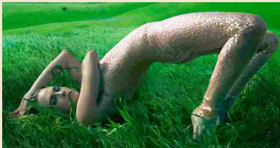
▲ Cara Delevigne indossa la tuta con bio-paillettes di Stella McCartney sulla cover di Vogue America

🔊 Ascolta la versione audio dell'articolo