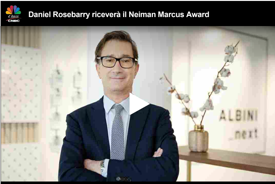
Daniel Roseberry riceverà il Neiman Marcus Award